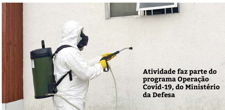
Atividade faz parte do programa Operação Covid-19, do Ministério da Defesa

Na última terça-feira (9), 42 militares, do Exército Brasileiro, pertencentes ao 1º Batalhão de Defesa Química, Biológica, Radiológica e Nuclear (1º Btl DQBRN), do Estado do Rio de Janeiro, realizaram, na última terça-feira (9), a desinfecção na área externa e na recepção do Hospital Santo Amaro (HSA).