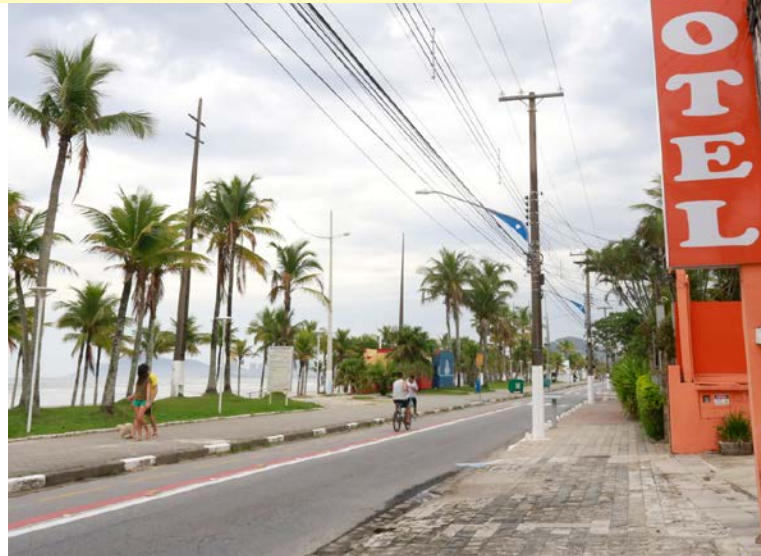
Medida abrange hotéis, pousadas, colônias de férias e pensões

Por força desse diferencial, a Prefeitura de Guarujá resolveu não dar isenção, mas, postergar o pagamento do IPTU de junho para dezembro, a fim de que quando esses meios